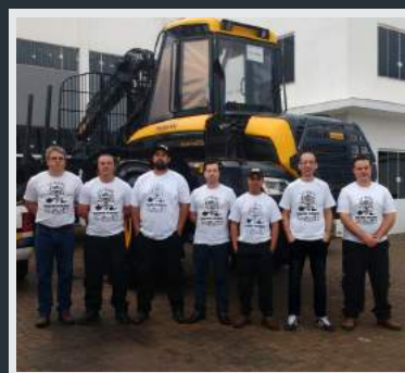
Equipe da TIMBER FOREST de Guaíba-RS

Na filial gaúcha em Guaíba-RS não é diferente, possui um corpo operacional com profissionais em constante atualização, estoque de peças e um atendimento refinado aos clientes do Rio Grande do Sul.